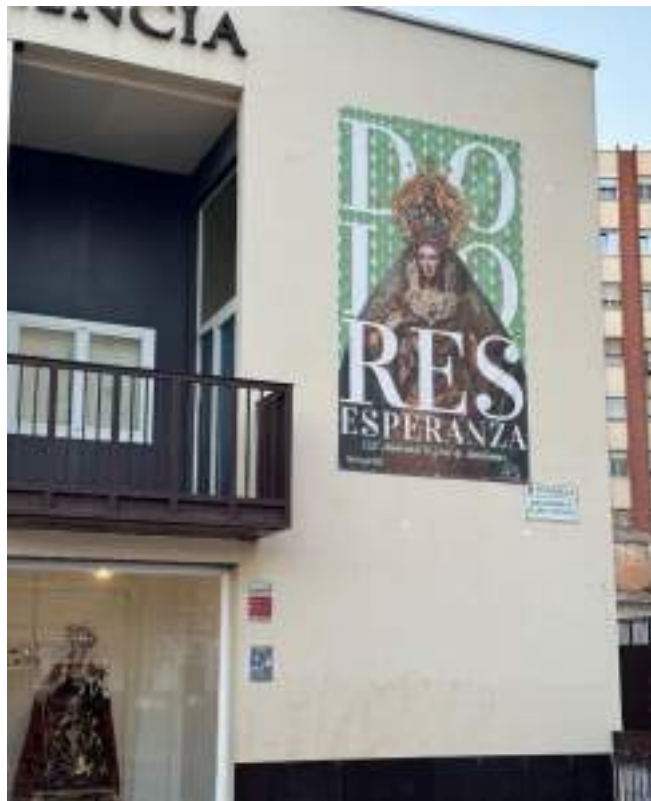
Figura 42. Ejemplo de cartelería que podría incluirse para los talleres artesanales. En la imagen, cartel promocional en la Casa Hermandad de Humildad y Paciencia sobre la procesión extraordinaria de la Virgen de Dolores y Esperanza del 21 de Septiembre de 2024. Elaboración propia.