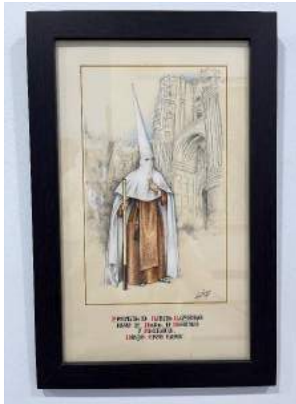
Figura 28. Diseño del proyecto del hábito de nazareno para la Hermandad de Humildad y Paciencia por Curro Claros en 2018, ubicado en la Casa Hermandad. Elaboración propia.