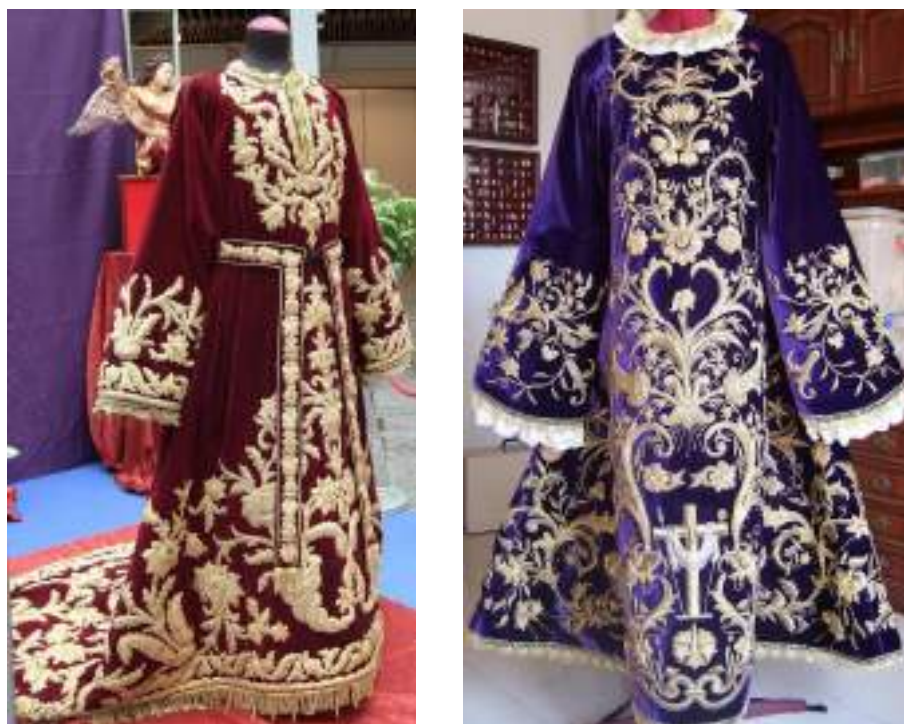
Figuras 13 y 14. Túnicas realizadas en el taller de Juan Rosén. Junta de Andalucía (s.f.).