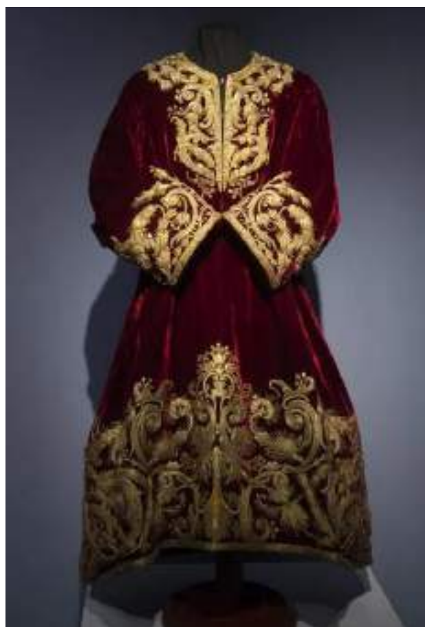
Figuras 8 y 9. Túnica más antigua de la Semana Santa. Cristo de las Tres Caídas de San Isidoro (Sevilla). Pasión en Sevilla (26 de febrero de 2021).