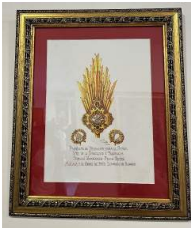
Figura 29. Diseño del proyecto de potencias para el Santísimo Cristo de la Humildad y Paciencia por Fernando Prini Betés en 2020, ubicado en la Casa Hermandad. Elaboración propia.