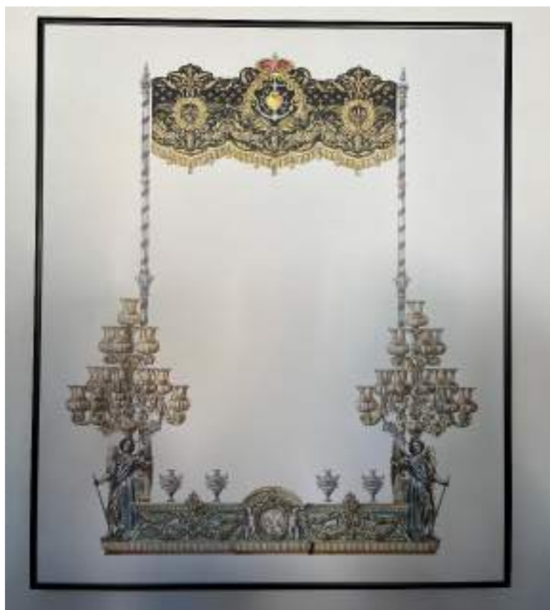
Figuras 26 y 27. Diseño de trono procesional de María Santísima de Dolores y Esperanza (Hermandad de Humildad y Paciencia) por Francisco Naranjo Beltrán en febrero de 2024, ubicado en la Casa Hermandad. Elaboración propia.