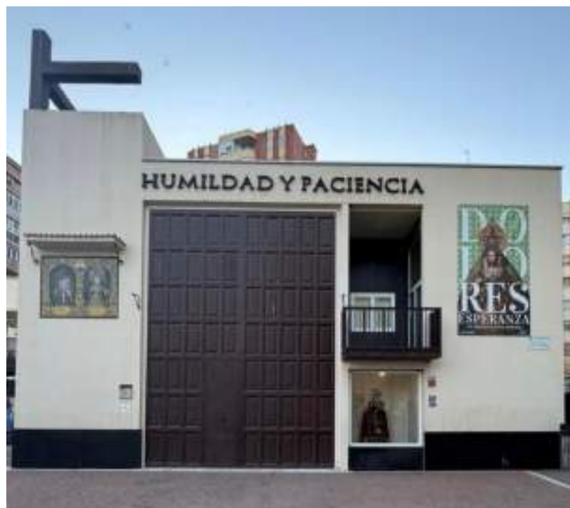
Figura 43. Imagen completa de la Casa Hermandad con el cartel a la derecha. Elaboración propia.