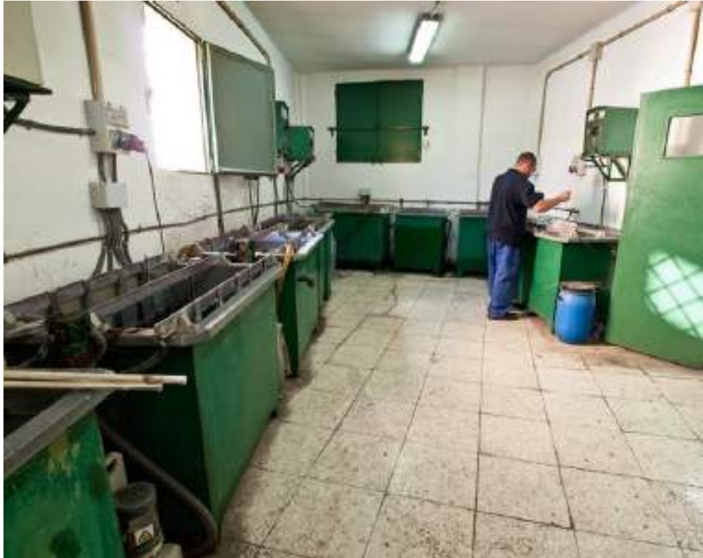
Figuras 19 a 22. Instalaciones del taller de Cristóbal Martos. Orfebrería Cristóbal Martos (s.f.).