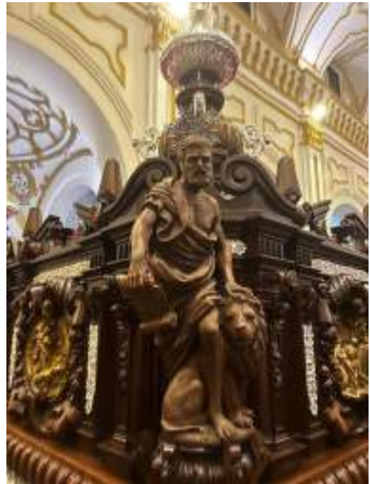
Figuras 5 y 6. Detalle de las esculturas de los profetas que adornan las esquinas del nuevo trono de Dolores del Puente, obras de Suso de Marcos. Elaboración propia.