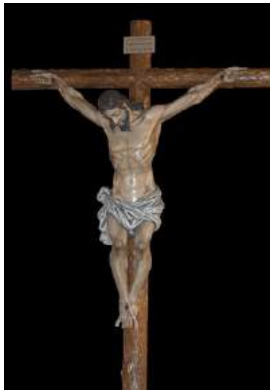
Figura 7. Cristo de la Vera Cruz de la Cofradía de los Verdes, Alhaurín de la Torre, obra de Suso de Marcos. Suso de Marcos (s.f.).