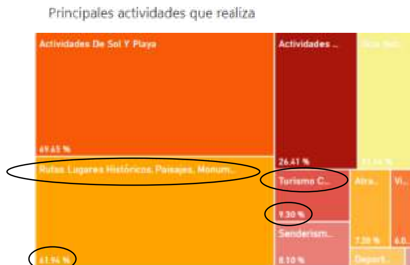
Figura 2. Big Data Características de la Demanda Turística de la Costa del Sol. Principales Actividades que Realiza. Turismo y Planificación Costa del Sol (2023).

Por otro lado, una vez que el turista viene a Málaga y está en el destino, las actividades principales que realiza están ligadas a la actividad cultural. Se encuentran en este caso las Rutas a Lugares Históricos, Paisajes, Monumentos, etc. (61,94%) y el Turismo Cultural: Visitar Museos, Galerías, Exposiciones, etc. (9,30%).