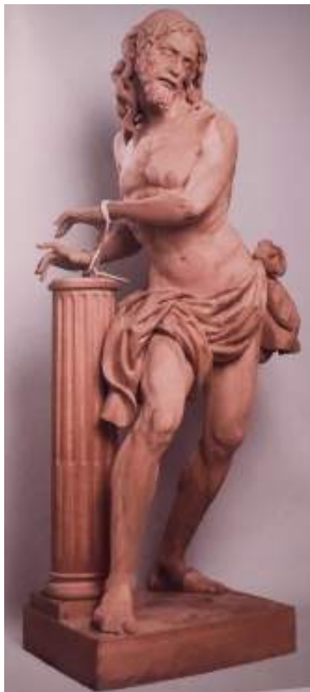
Figura 2. Imagen detalle del Cristo atado a la columna. Twitter Nazareno de Redención (20 de marzo de 2023).