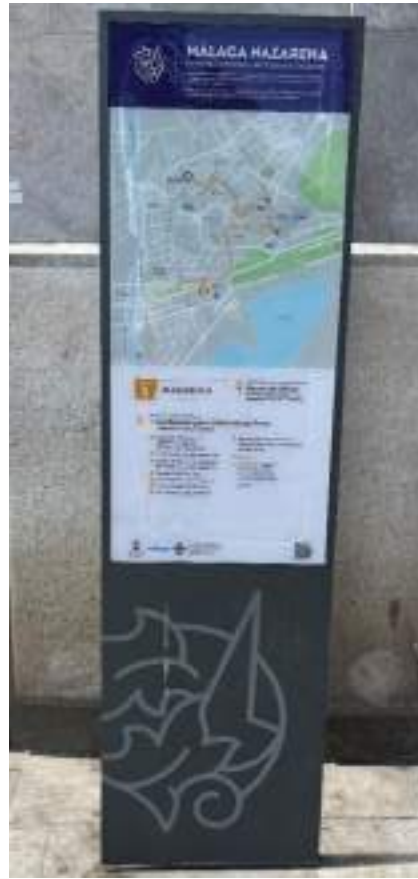
Figura 34. Cartelería oficial del itinerario Málaga Nazarena en Calle Larios. Elaboración propia.