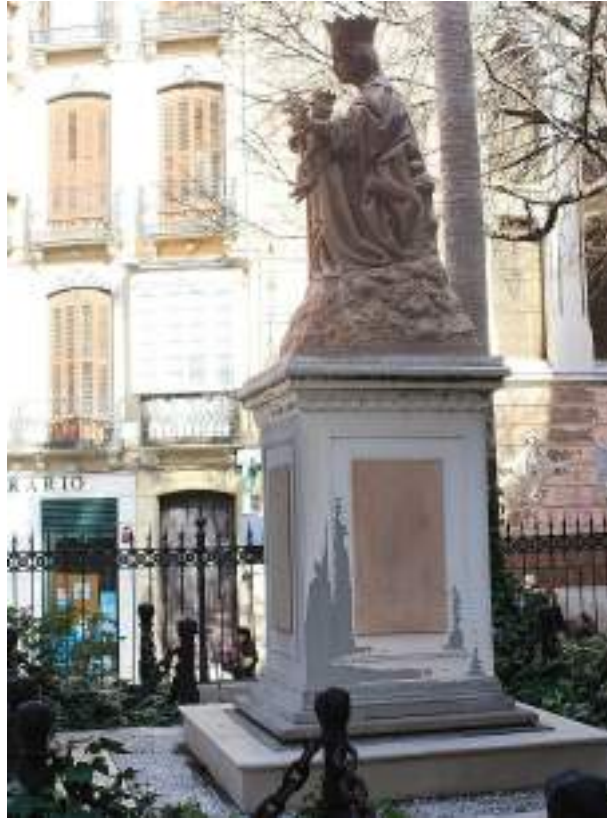
Figura 3. Escultura de Santa María de la Victoria en los jardines de la Catedral de Málaga, obra de Suso de Marcos.