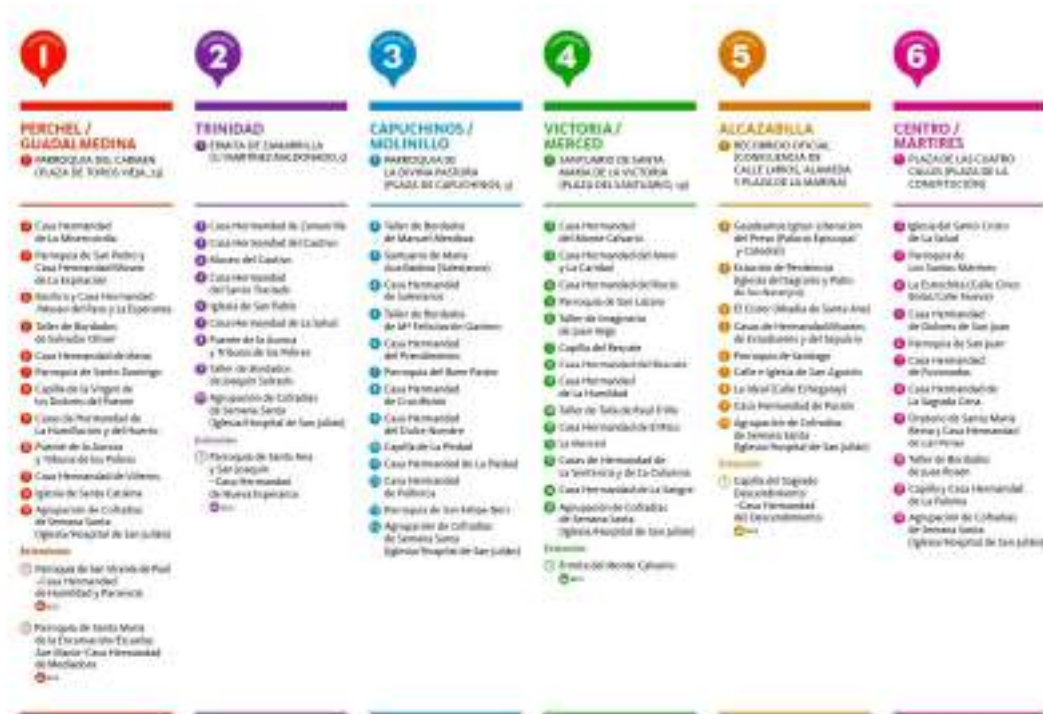
Figuras 35 y 36. Recorridos del itinerario cofrade Málaga Nazarena. Agrupación de Cofradías (26 de marzo de 2021).