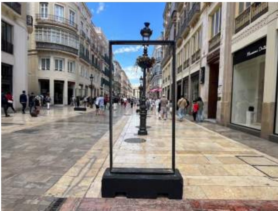
Figura 45. Mupi ubicado en Calle Larios, soporte donde se ubicaría la galería fotográfica e informativa acerca de los talleres artesanales. Elaboración propia.