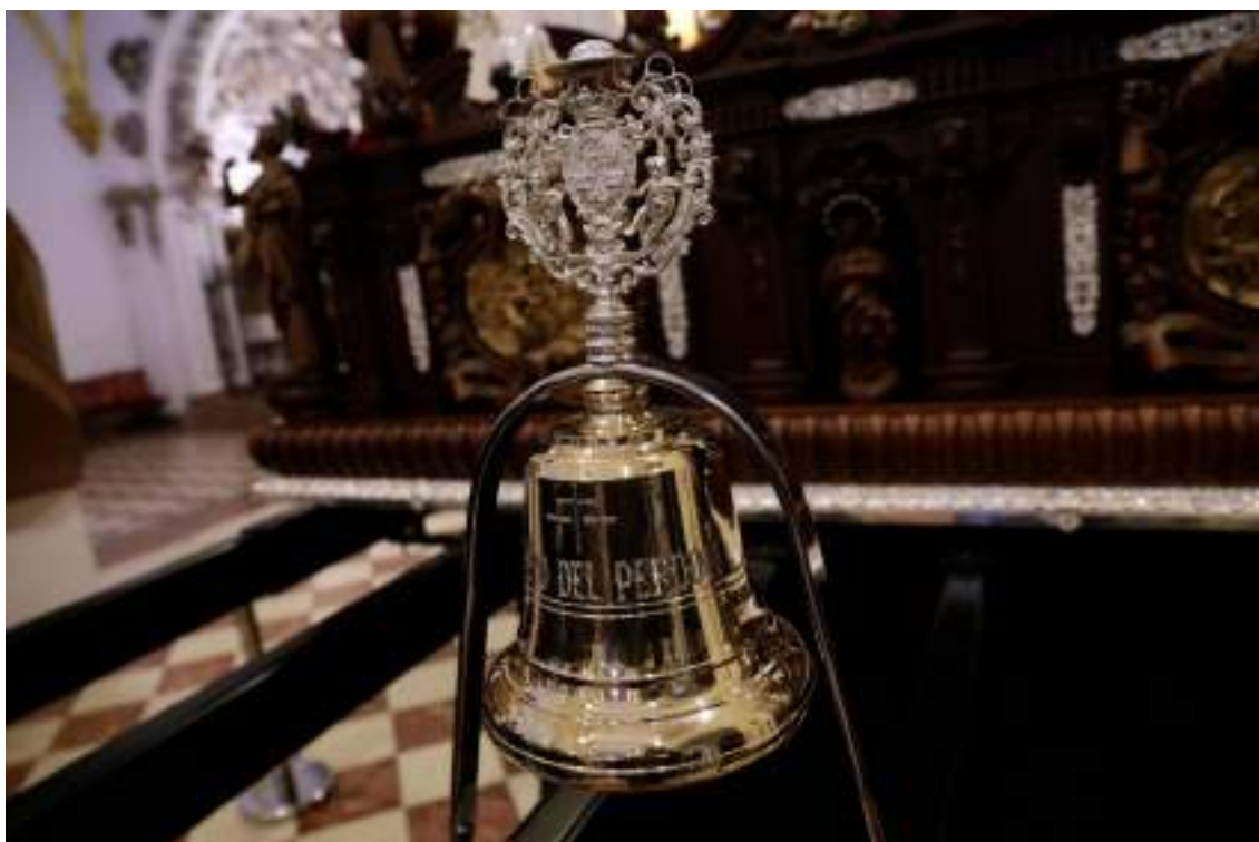
Figura 25. Arco de campana del nuevo trono del Cristo del Perdón (Hermandad de los Dolores del Puente) que contiene la heráldica de la Hermandad, realizado en el taller de Cristóbal Martos. Diario Sur (3 de abril de 2023).