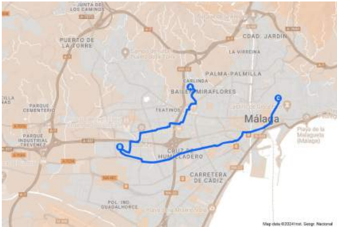
Figura 9. Ubicación y recorrido de los talleres artesanales de los orfebres en Málaga capital. Elaboración propia a través de My Maps.

La imagen anterior muestra la ubicación y recorrido de los talleres artesanales de los orfebres en Málaga capital. Así, los puntos se distribuyen en A, Taller de Orfebrería Cristóbal Martos; B, Taller de Orfebrería Diego Martín e Hijos; C, Orfebrería Nuestra Señora de la Victoria.