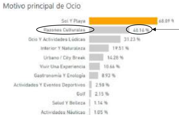
Figura 1. Big Data Características de la Demanda Turística de la Costa del Sol. Motivo Principal de Ocio. Turismo y Planificación Costa del Sol (2023).

Uno de los segmentos que más ha crecido es el turismo cultural, tal y como reflejan los datos obtenidos por Turismo y Planificación Costa del Sol en el análisis de su Big Data.