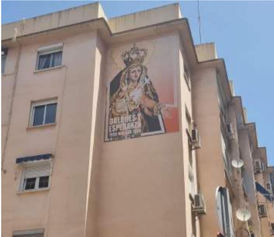
Figura 44. Ejemplo de cartelería que podría incluirse para los talleres artesanales. En la imagen, cartel promocional en la calle La Unión, sobre la procesión extraordinaria de la Virgen de Dolores y Esperanza del 21 de Septiembre de 2024. Elaboración propia.