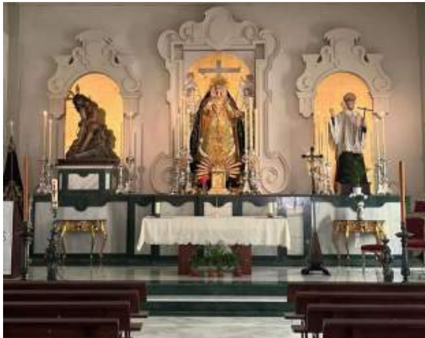
Figura 41. Interior de la Iglesia de San Vicente de Paúl, sede canónica de la Cofradía de Humildad y Paciencia. Elaboración propia.