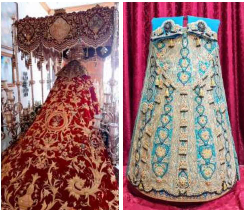
Figuras 15 y 16. Manto de Procesión y Saya sobre chaquetilla de torero de María Santísima de la O realizados en el taller de Juan Rosén. Cofradía de la Columna (s.f.).