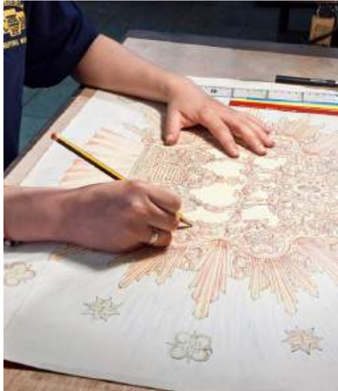
Figura 23. Detalle del diseño de una corona en papel para su posterior realización en el taller. Orfebrería Cristóbal Martos (s.f.).