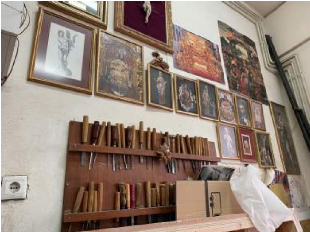
Figuras 38 y 39. Detalles de taller de Trillo y Lamas. El Itinerario (27 de marzo de 2022).