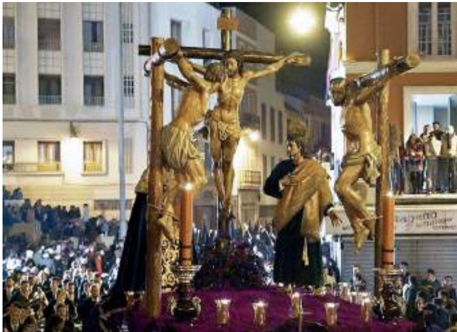
Figura 4. Cristo del Perdón, ladrones crucificados (Dimas y Gestas) y San Juan, de la Cofradía de los Dolores del Puente, obras de Suso de Marcos. Semana Santa Málaga.info (s.f.).