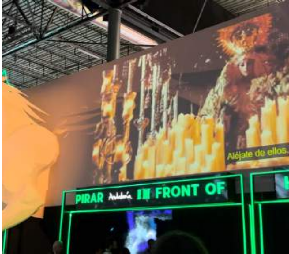
Figura 48. Campaña publicitaria Andalusian Crush emitida en el pabellón de Andalucía en FITUR 2024, con la imagen de María Santísima de la O, de la Cofradía de la Columna de Málaga. Elaboración propia.