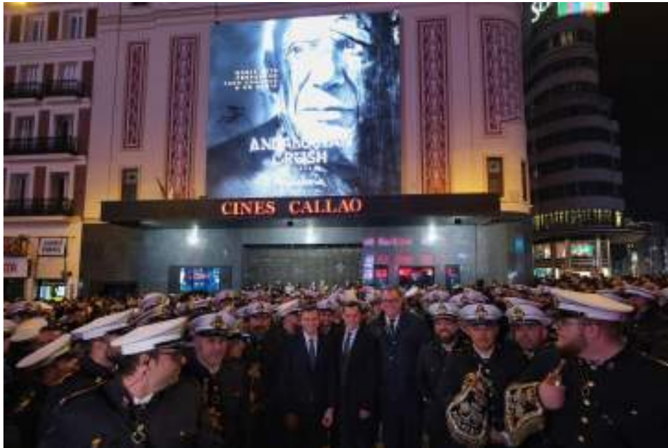
Figura 46. La banda gaditana Rosario de Cádiz frente a los Cines Callao de Madrid con motivo de la edición FITUR 2024, junto al Presidente de la Junta de Andalucía, Juanma Moreno, y el Consejero de Turismo, Arturo Bernal. Pasión por Mvnda. (24 de enero de 2024).