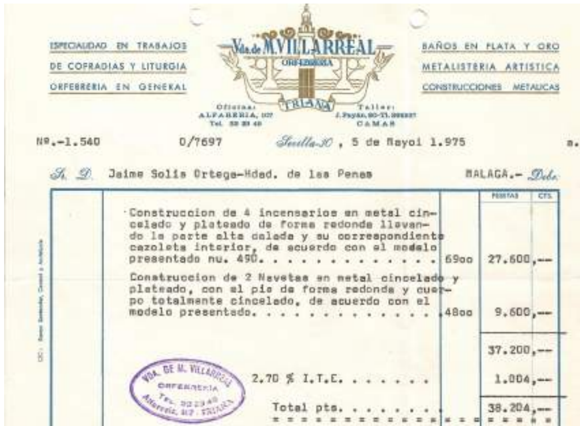
Figura 2.4.1 Contrato incensarios y navetas.