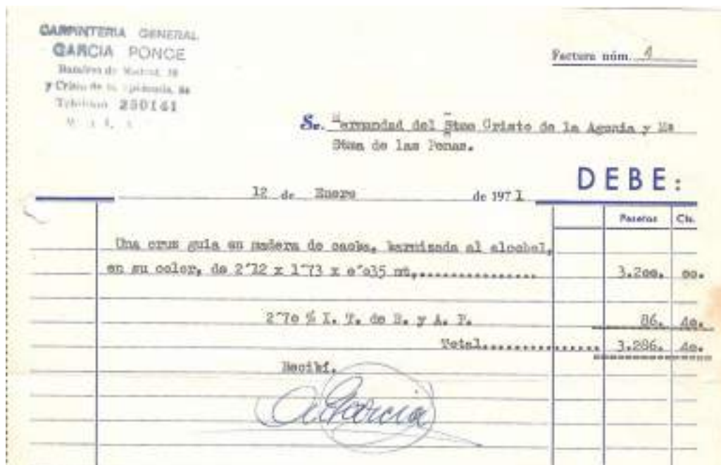
Figura 2.1.1 Contrato Cruz de Guía.