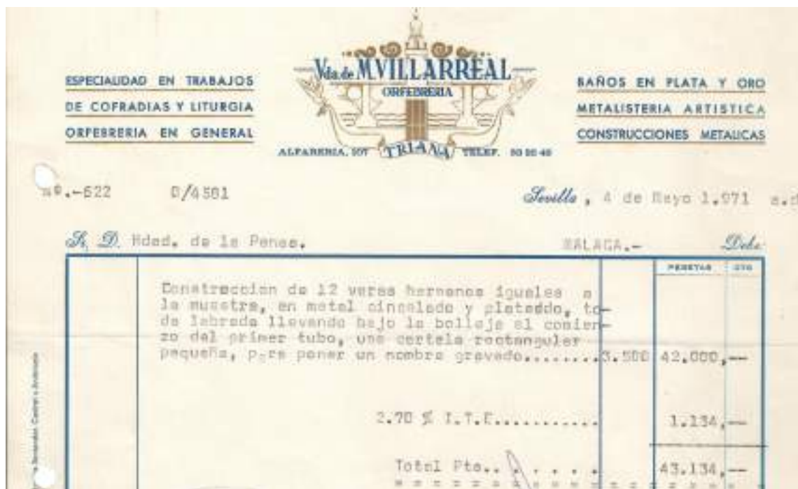
Figura 2.1.3 Contrato 12 varas.